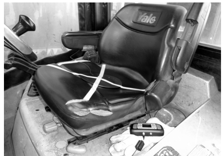
그림 2: WBV 측정

고려 대상 작업을 대표하도록 일상적인 작업 동안 측정을 수행해야 한다. 위에 나타난 3개 방향의 3개 가속도 값 모두를 기록한다.