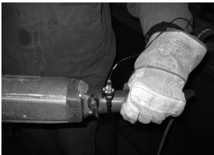
그림 1: HAV 측정

측정을 위해 특수 설계된 3축 가속도계를 손잡이에 클램프로 고정하거나 접착제로 붙인다.