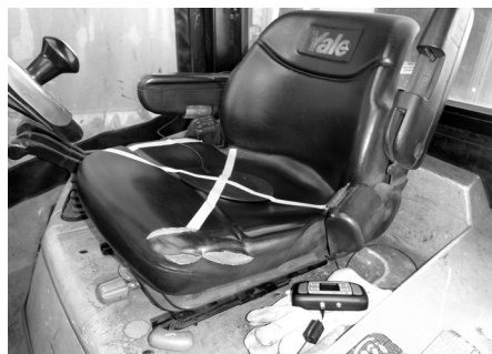
Figura 2: Medición de VCE

Una medición de la vibración del cuerpo entero se realiza. p.ej. en el asiento del conductor del vehículo a medir. La almohadilla detectora de aceleración triaxial se fija con cinta adhesiva al asiento. Aquí se debe tener en cuenta la correcta colocación de la almohadilla (x = dirección pecho-espalda, y = direc-