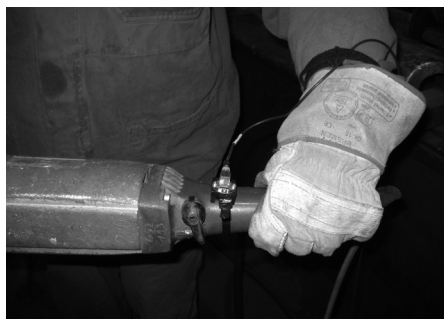
Figura 1: Medición de VMB

Las mediciones mano-brazo se realizan en la respectiva agarradera de la máqui-