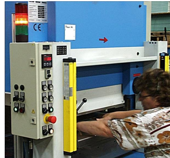
Absicherung einer Stanze durch einen Lichtvorhang

Finger- und Handschutz bzw. Gefahrenbereichssicherung an Maschinen, wie z. B. Pressen, Bestückungsautomaten, Holz-, Druck- und Papierverarbeitungsanlagen oder Maschinen der Lager- und Fördertechnik