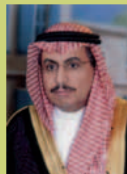
西利曼·S. 阿尔-胡马伊德 署长 社会保障总署

“沙特社保总署因获得国际社会保障协会良好实践奖的成就，受到两圣寺守护者阿卜杜拉·本·阿卜杜勒阿齐兹国王(King Abdullah bin Abdulaziz)的感谢和赞赏。媒体也赞扬沙特社会保障总署荣获该奖。所有这一切都将激励沙特社保总署争取更大的进步和成就”。