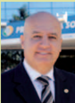
瓦尔迪尔·莫伊西斯·西芒 署长 全国社会保障署

“我们很荣幸荣获此奖，这个制度是我们的公务员工作的结果。表彰这些努力是对我们开发新的思路的一种激励。我们要继续为在巴西国内和国外的社会保障制度的扩大覆盖面、现代化和达标做出贡献。”