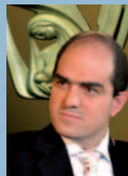
丹尼尔·卡拉姆·图麦 署长 社会保障署

“评估和加强竞争性执行技能的模型(MEFHADIC)获得国际社会保障协会的表彰,墨西哥社会保障署感到很自豪;这将激励我们社保署对社会保障原则和价值的承诺。这个奖项表明,良好实践就是那些旨在提高服务质量的方法。”